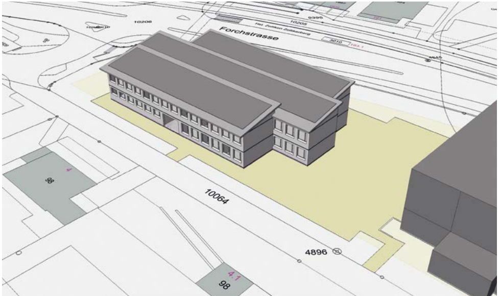
Visualisierung Provisorium in Leichtbauweise mit geneigtem Dach