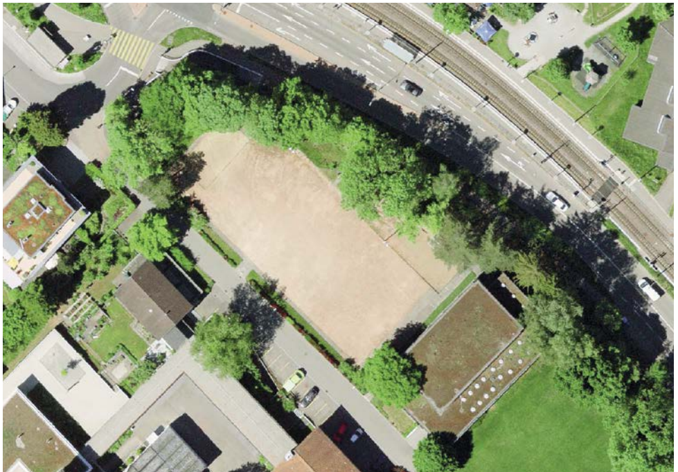
Luftaufnahme Sandplatz beim Schulhaus Rüterwis, Zollikerberg